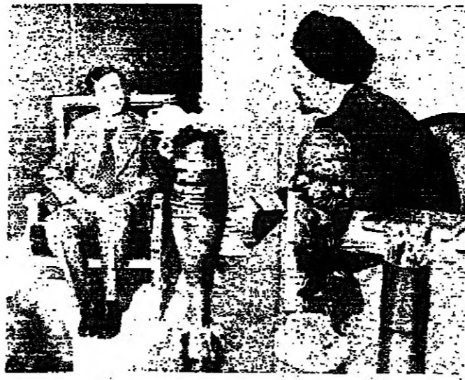
جنبلاط في زيارة الاسم المرمز